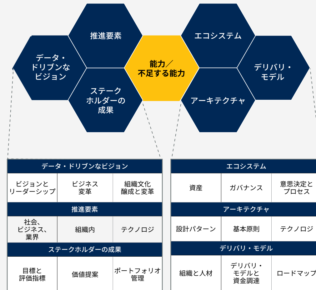
Gartner データ／アナリティクス戦略およびオペレーティング・モデル (DASOM) フレームワーク

データ／AI リテラシーの向上、AI 活用に向けた備え、組織文化変革、そしてスキルを備えた人材の育成は、D&A 戦略をビジネス戦略と結び付けるうえで重要な要素です。